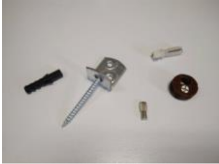
(Ενδεικτικά στοιχεία σύνδεσης)